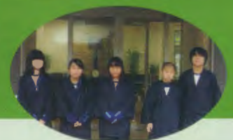
《佐野中学校の様子は第76号に掲載》