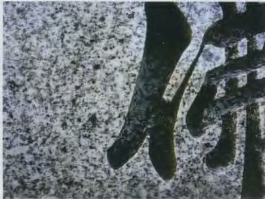
ペンキの色落ちの一例

いつもお世話になります。墓石及びメンテナンス担当の関西聖地販売です。ところで皆様のお墓はメジが外れていたり、ペンキが抜けていたりしていませんか？以前にもご案内いたしました、高級な御影石で建てたお墓も日々風雨にさらされている建築物ですから当然古くなればそれなりにメンテナンスが必要です。お施主様の中で建立してから10年以上たっているお墓は今一度ご確認下さい。この機会にリフォームをしてみようと思われるお施主様がいらっしゃいましたらお気軽にお声かけください。参考までに下記にメンテナンスの費用を記載致しました。